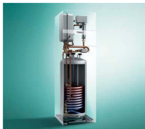
A monoblokk megoldás kompakt egysége (uniTOWER)