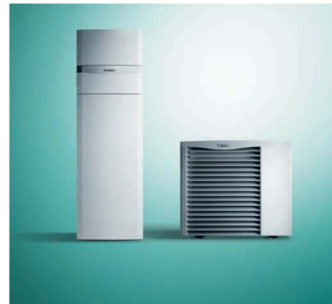
uniTOWER kompakt beltéri egység aroTHERM hőszivattyúval