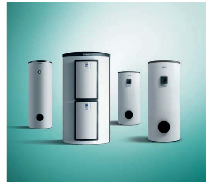
uniSTOR VIH RW 200, allSTOR exclusiv, uniSTOR plus VIH SW vagy VIH RW tárolók