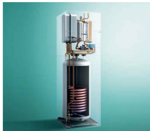
Az osztott hűtési körű megoldás kompakt beltéri egysége (uniTOWER VWL .8/5 IS)